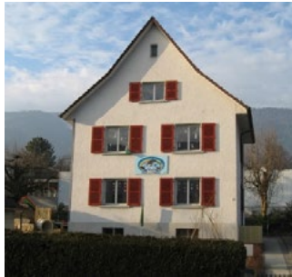
Erster Standort Kindertagesstätte